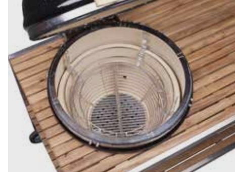
Kohlekorb mit Trenner