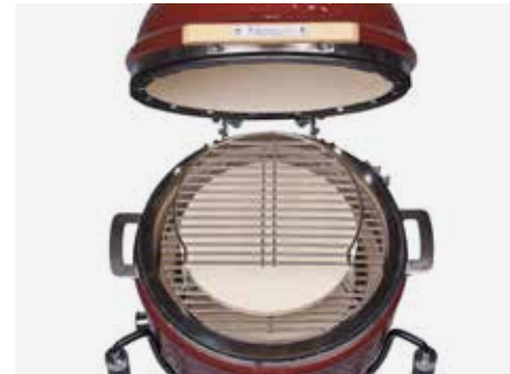
Komplettaufbau mit Edelstahlgrillrost und Zusatz-Grillrost