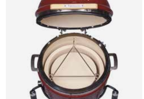
Deflektorstein mit Distanzstück zum indirekten Garen