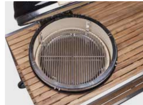
Deflektorstein geteilt, Tropfschale geteilt, zwei halbe Edelstahlroste, Ring zur Höhenverstellung