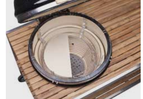
Deflektorstein (geteilt) mit Distanzstück zum indirekten Garen