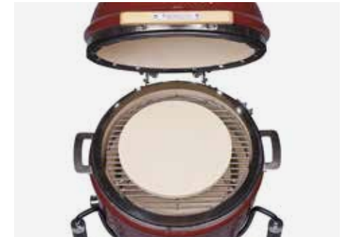
Aufbau für Pizza (optionales Zubehör)