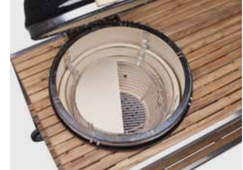
Deflektorstein (geteilt) mit Distanzstück zum indirekten Garen