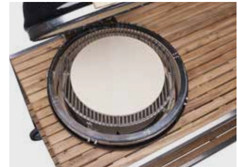
Aufbau für Pizza (optionales Zubehör)