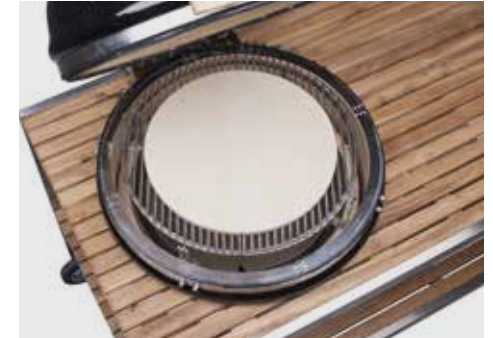
Aufbau für Pizza (optionales Zubehör)