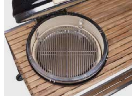
Deflektorstein geteilt, Tropfschale geteilt, zwei halbe Edelstahlroste, Ring zur Höhenverstellung